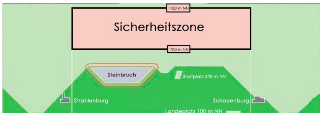
Grafisches Lagebild der Sicherheitszone